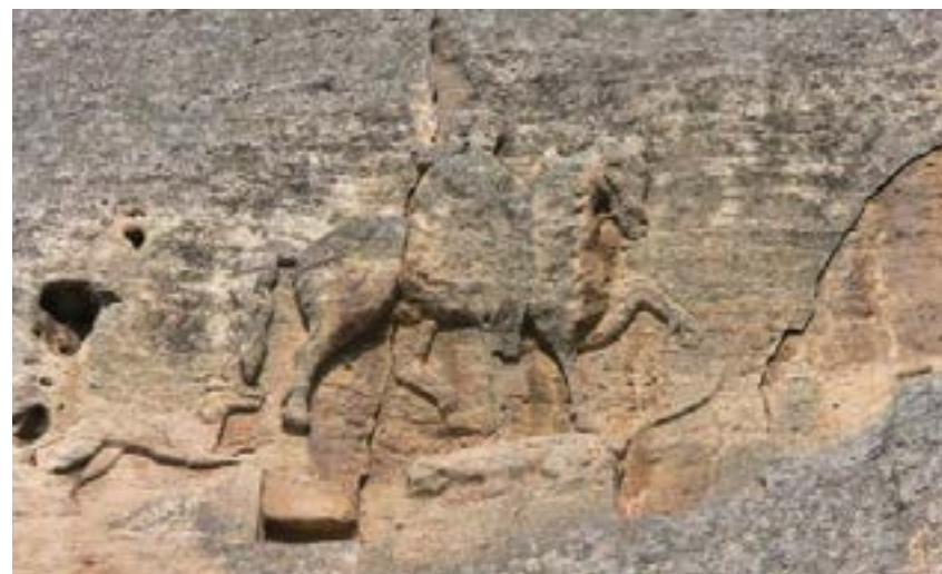
Ил. 1. Мадарският релеф

Strzygowski, J. (1910). Amida , Heidelberg