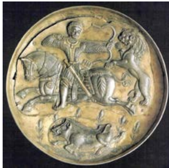
Ил. 6. Согдийски ездач (сребърно блюдо с позлата) – VIII век