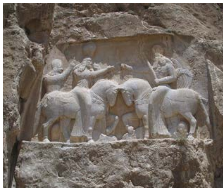
Ил. 2. Сасанидски релеф – Ардашир I и Ахурамазда