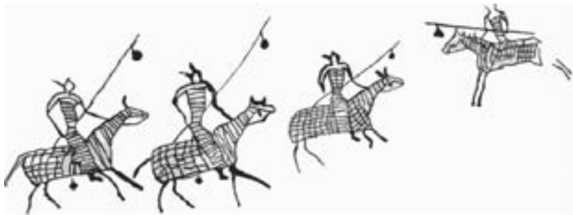
Ил. 4. Петроглифи от Монголия (Хар-хад)