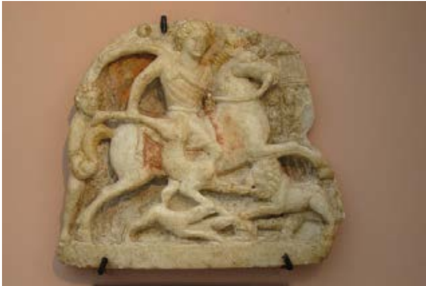
Ил. 3. Тракийски херос